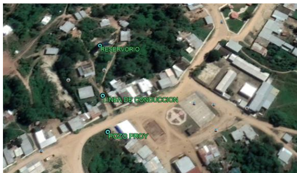
Vista satelital de la zona a intervenir en el proyecto.

En Zarumilla, los veranos son largos, muy caliente y nublados; los inviernos son largos, caliente, secos y parcialmente nublados y está opresivo durante todo el año. Durante el transcurso del año, la temperatura generalmente varía de 21 °C a 31 °C y rara vez baja a menos de 19 °C o sube a más de 32 °C., el periodo de lluvias en esta localidad es desde el mes de Diciembre al mes de Abril, las precipitaciones más intensas se dan entre los meses de Febrero y Marzo.