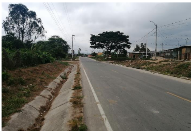
FOTOGRAFIA N° 01

Vista de la vía de acceso principal Carretera Asfaltada de Zarumilla a Matapalo