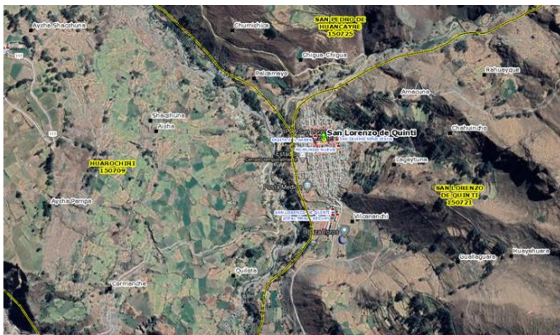
IMAGEN N° 01: Imagen Satelital del Distrito San Lorenzo de Quinti

PLANO DE INTERVENCIÓN EN COORDENADAS UTM GEOREFERENCIADO Y EL ÁREA DE INFLUENCIA DE LA INTERVENCIÓN