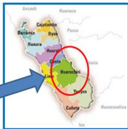
MAPA N° 2 LOCALIZACIÓN DEPARTAMENTAL