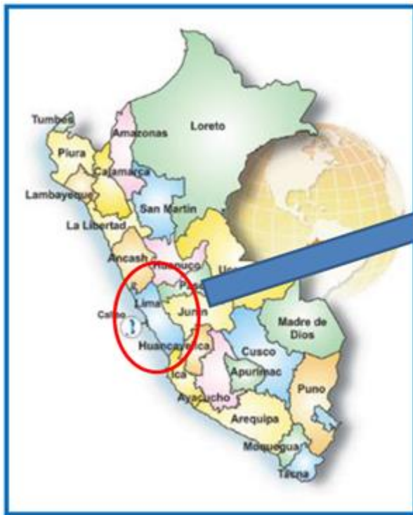
MAPA N° 1 LOCALIZACIÓN NACIONAL