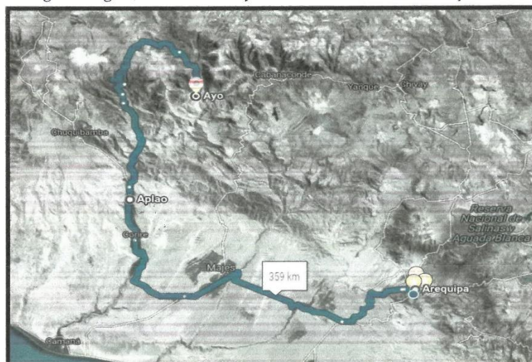
Vías de acceso y medios de transporte

En la siguiente figura, se muestra el esquema de macro localización de Ayo