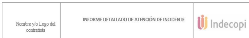
Cuadro N° 2