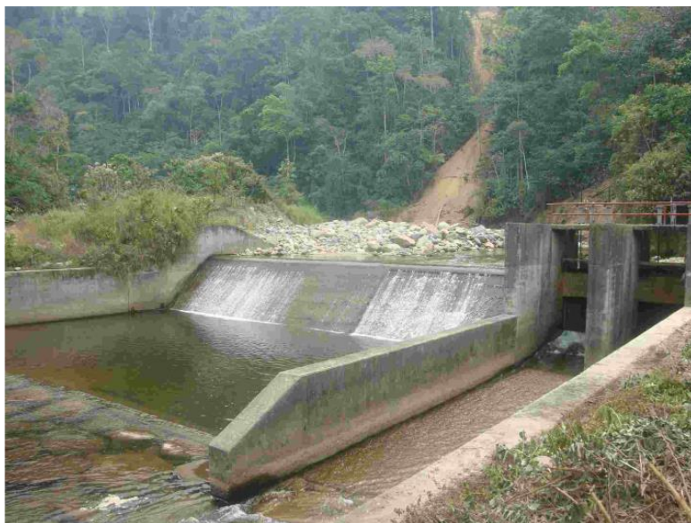
FOTOGRAFÍA 2. Represa Llaylla.