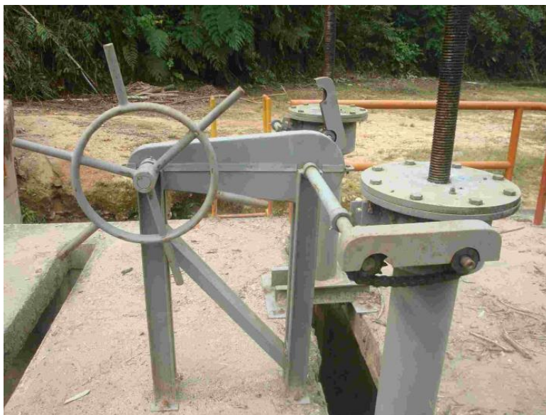
FOTOGRAFÍA 3. Mecanismo de izaje y tornillo con mando manual