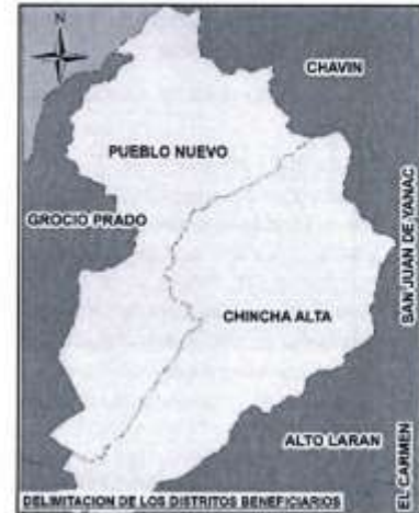
Imagen N° 3: Mapa de Ubicación de los distritos beneficiarios