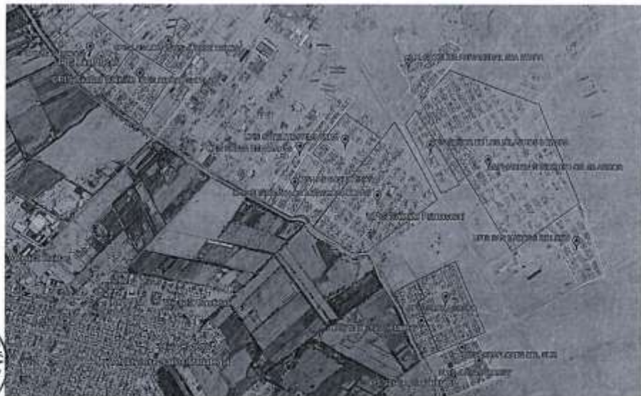
Imagen N°4: Ubicación satelital de los Asentamientos Humanos del ámbito del proyecto