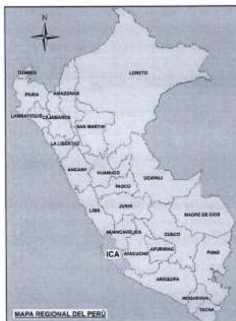
Imagen N° 1: Mapa de Ubicación de la Región de Ica

El área de estudio del proyecto está conformada, se encuentra en los distritos de Pueblo Nuevo y Chincha Alta de la Provincia de Chincha.