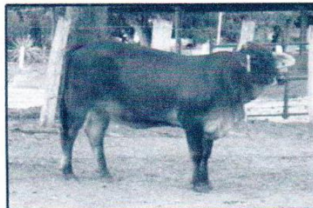
Vaquillona Brown Swis x Brahman