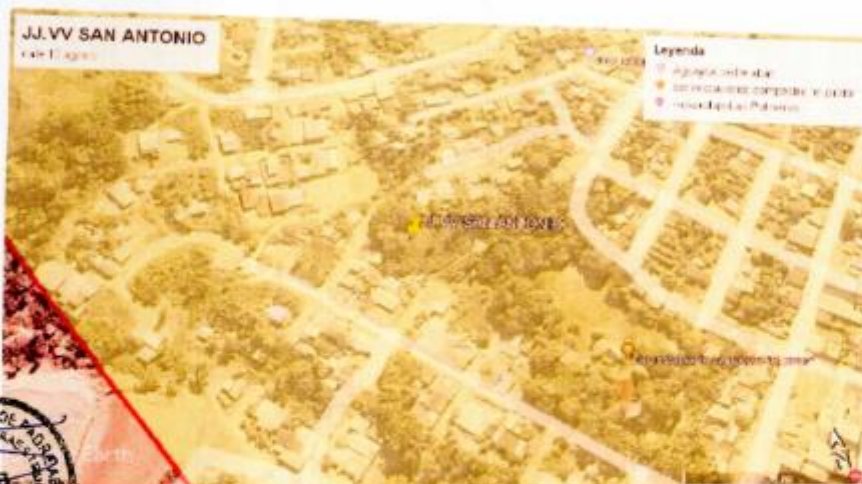
Ilustración 1. Vista Satelital de la Ubicación de la J.J. VV San Antonio