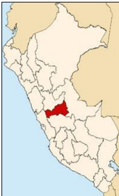
A NIVEL NACIONAL