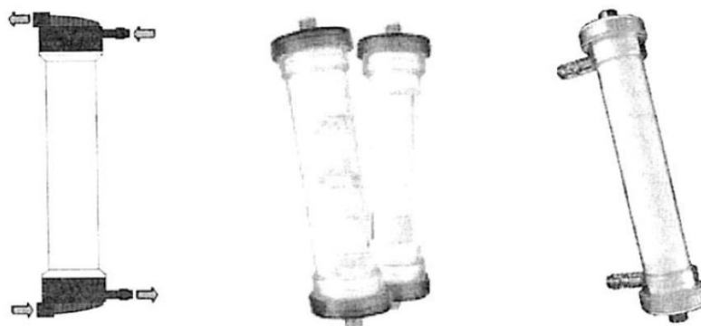
Fig. 1.: Dializador para Hemodiálisis de Bajo Flujo de Membrana Sintética (No implica diseño)