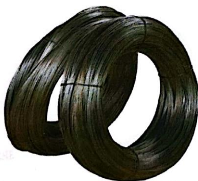
Alambre negro recocido N° 16

Alambre de uso en la industria de la construcción para amares de fierros corrugados en todo tipo de estructuras y otros trabajos de apoyo.