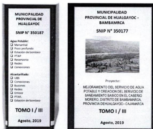
Figura 01: Forma de Presentación del Expediente Técnico (Referencial)

Los expedientes deberán ser presentados en archivadores de palanca de lomo ancho. Cada archivador deberá considerar una carátula en la parte frontal y en lomo del mismo, para una rápida verificación. Se recomienda que dichas carátulas, deberán indicar como mínimo, lo indicado en la figura 01.