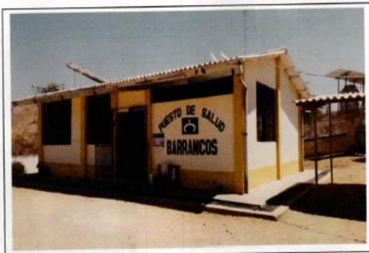
ARQUITECTURA EXISTENTE DE BLOQUE RECTANGULAR

El piso de área libre es de tierra y aserrín, lo que dificulta la accesibilidad par personas mayores o con discapacidad.