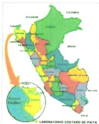
MAPA POLITICO DE PIURA