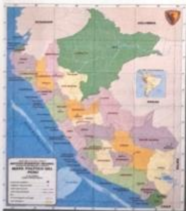
ILUSTRACION 01: Ubicación política de la zona de Intervención