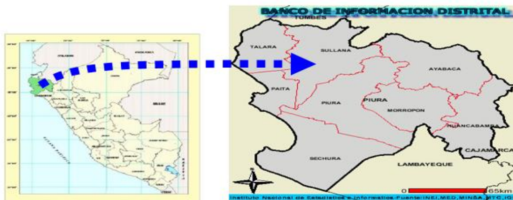
Esquema de Ubicación Geográfica