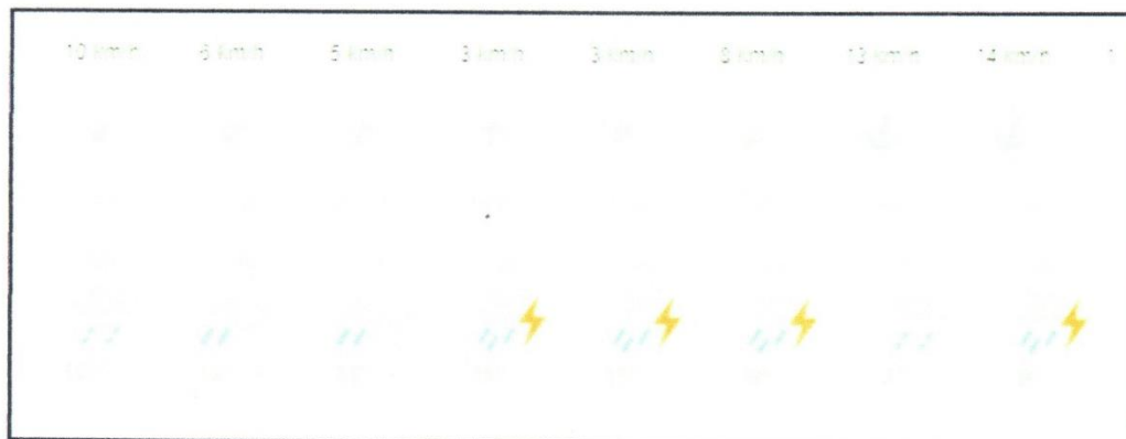
Registro del viento