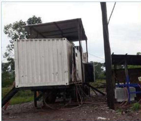
Vista del container del Grupo Elecrogeno CAT 3412 de la CT Codo del Pozuzo