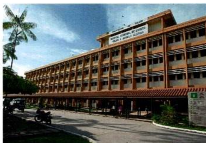
Vista 01 / Hospital Regional de Loreto "Felipe Arriola Iglesias" – Ingreso principal – Av. 28 de Julio.

El proyecto de inversión a nivel del Expediente Técnico a ser formulado a Nivel de Estudio Definitivo se ha denominado como: "MEJORAMIENTO Y AMPLIACIÓN DE LOS SERVICIOS DE SALUD DEL HOSPITAL REGIONAL FELIPE ARRIOLA IGLESIAS, DISTRITO DE PUNCHANA, PROVINCIA DE MAYNAS, DEPARTAMENTO DE LORETO" . Código Único 2526257