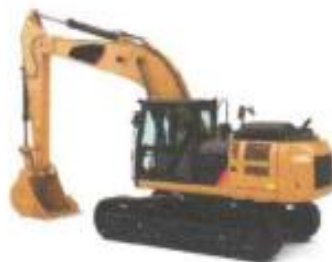
Tabla N° 01 – Cantidades