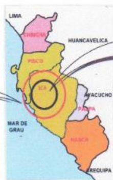
UBICACIÓN EN LA REGIÓN ICA