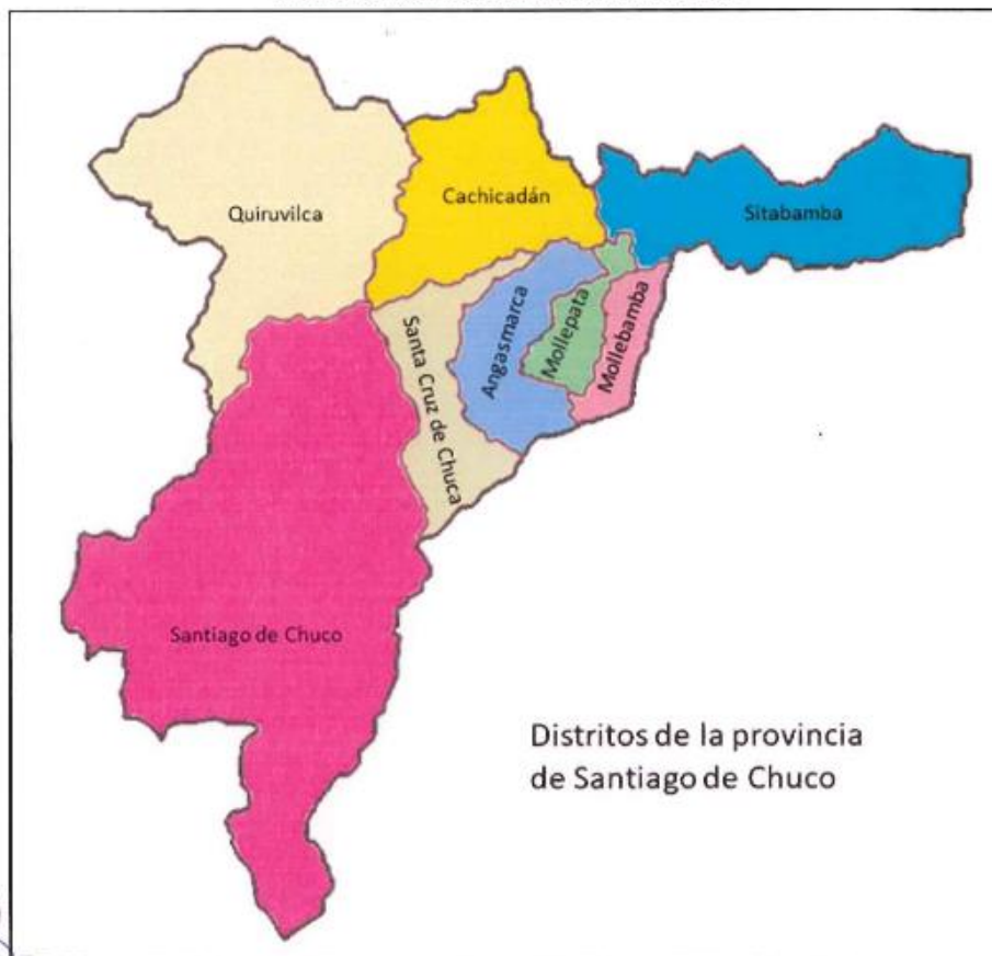
Gráfico 3 . Distrito de Santa Cruz de Chuca.