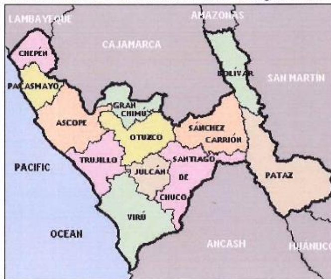
Gráfico 2. Localización Gráfica de la Provincia de Santiago de Chuco.