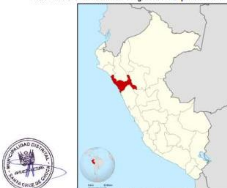
Gráfico 1 . Perú - Localización Geográfica del Departamento de La Libertad.