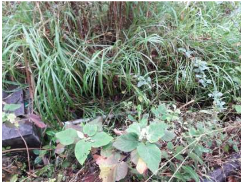
LINEA DE CONDUCCION

La Línea de Conducción tiene una longitud de 1,429.40 m. y tubería PVC de Ø1".