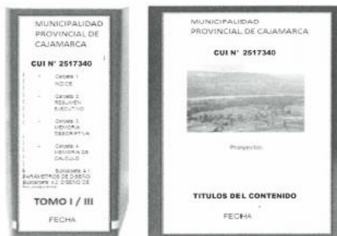
Figura 1: Forma de presentación del Expediente

El expediente técnico deberá ser presentado en archivadores de palanca de lomo ancho. Cada archivador deberá considerar una carátula en la parte frontal y en lomo del mismo, para una rápida verificación. Se recomienda que dichas carátulas, deberán indicar como mínimo, lo indicado en la figura 1.