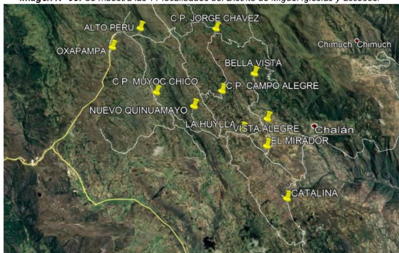
Imagen N° 03: Se muestra las 11 localidades del Distrito de Miguel Iglesias y accesos.

“Año del Fortalecimiento de la Soberanía Nacional”