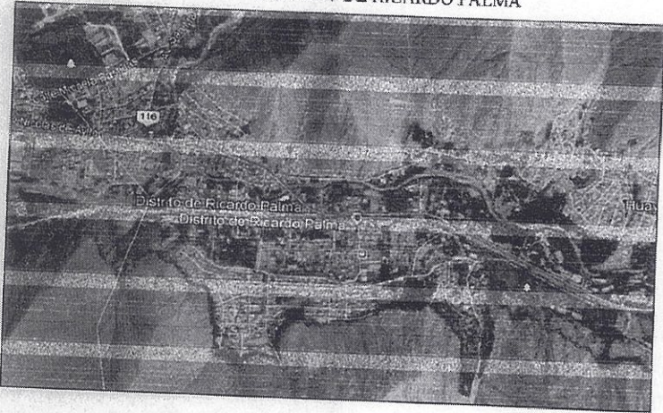
DISTRITO DE RICARDO PALMA

Plaza de Armas s/n – Ricardo Palma– Huarochiri – Lima.