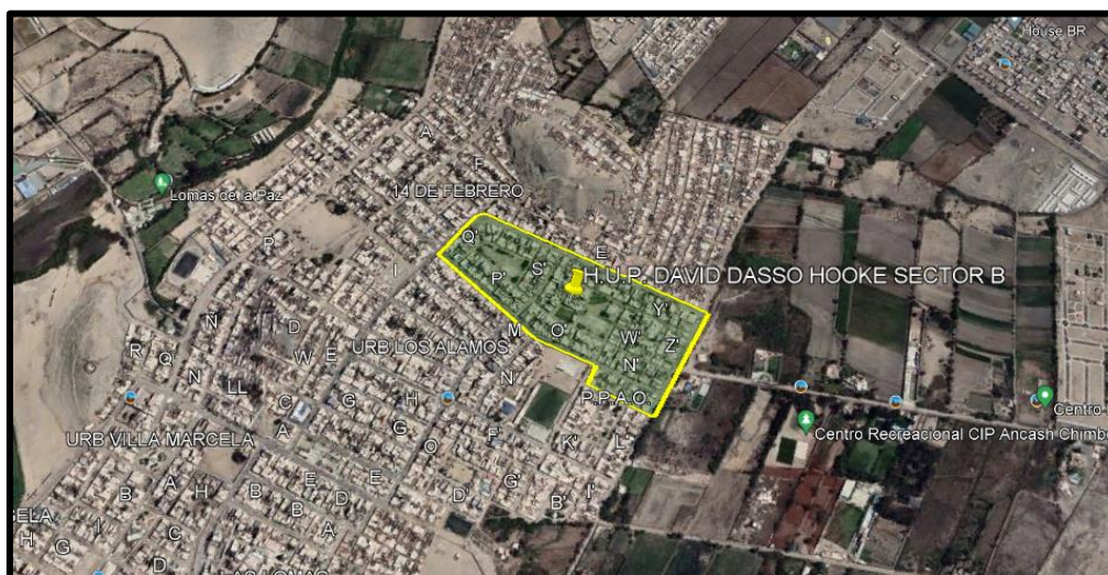
Micro Localización (Distrito Nuevo Chimbote – H.U.P. DAVID DASSO HOOKE SECTOR - B