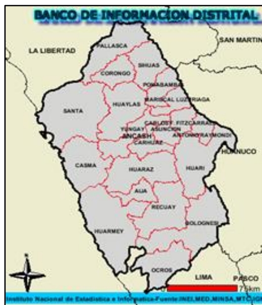
DPT. DE ANCASH