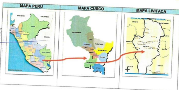
Figura 01. Ubicación Y Mapa Política Del Área De Estudio.

Ubicación Geográfica Del Área De Estudio Cuadro 01.01