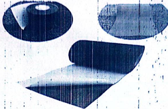
IMAGEN REFERENCIAL DEL DISEÑO DEL GRASS SINTÉTICO

Año de la Unidad, la Paz y el Desarrollo