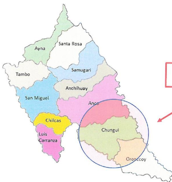
Mapa Nº 03: Ubicación Provincial