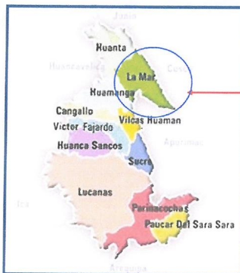
Mapa Nº 02: Ubicación Departamental