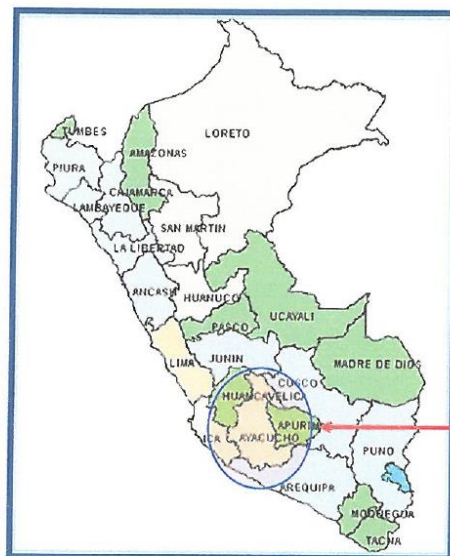
Mapa Nº 01: Ubicación Nacional