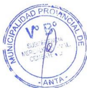
Ilustración 2 Imagen Referencial