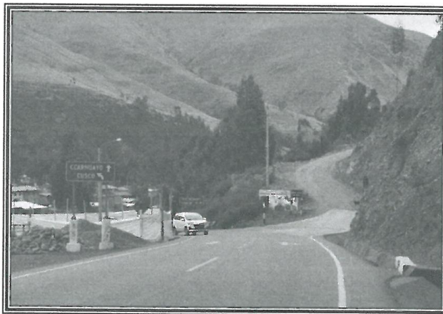
FOTO 01: Vista donde se aprecia el inicio (Km.00+00) de la carretera hacia Ccarhuayo