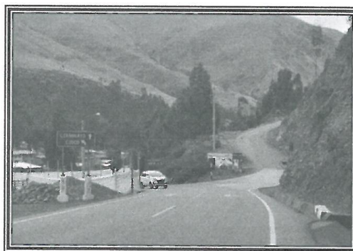
FOTO 01: Vista donde se aprecia el inicio (Km.00+00) de la carretera hacia Ccarhuayo