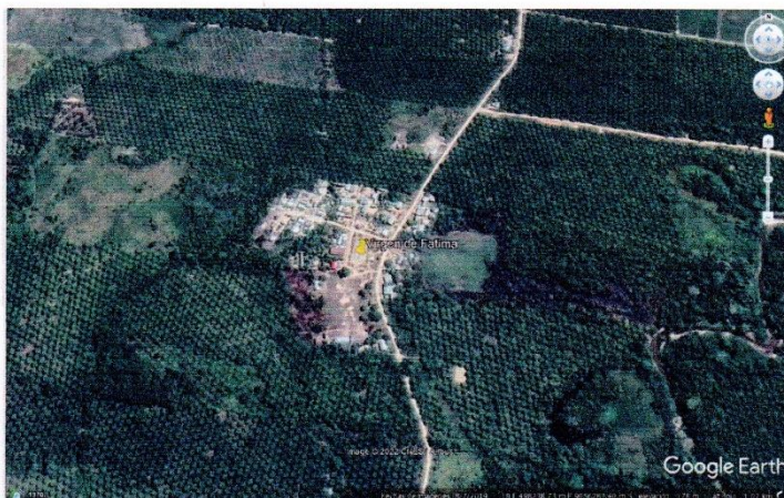
Vista del Caserio Virgen de Fátima

MUNICIPALIDAD DISTRITAL DE NESHUYA TERMINOS DE REFERENCIA - 2022