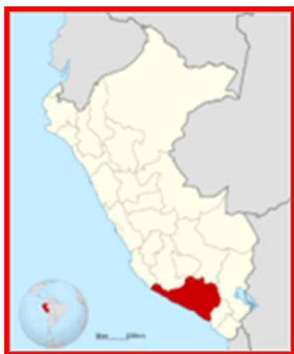
MAPA DEPARTAMENTAL DEL PE RU

Región: Arequipa Provincia: Condesuyos Distrito: Chuquibamba Centro poblado: pongo – esvilla