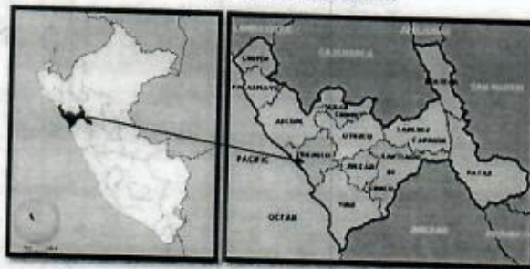
Imagen 01-06: Localización