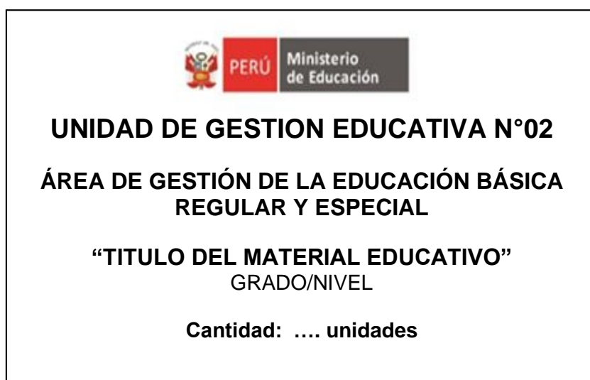
Figura N° 01 (referencial)