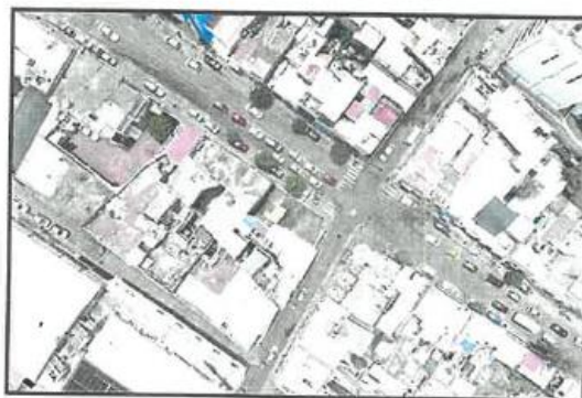
INTERSECCION. AVENIDA SAN MARTIN CON CALLE PUNO, SE OBSERVA PAVIMENTO DETERIORADO E INTENSO TRÁFICO.