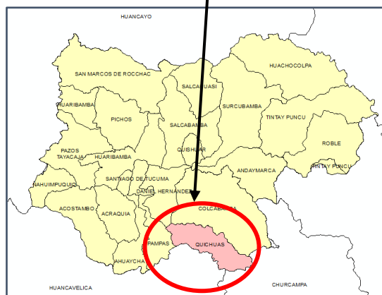
Ubicación política del distrito de Quichuas.