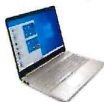
IMAGEN REFERENCIAL COMPUTADORA PORTATIL

Las características y especificaciones técnicas del producto son: