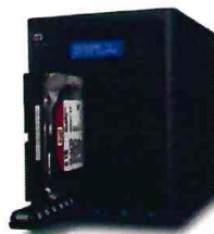
IMAGEN REFERENCIAL UNIDAD DE ALMACENAMIENTO DE RED

Las características y especificaciones técnicas del producto son: