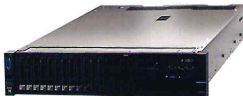
IMAGEN REFERENCIAL SERVIDOR TIPO 1

Las características y especificaciones técnicas del producto son: