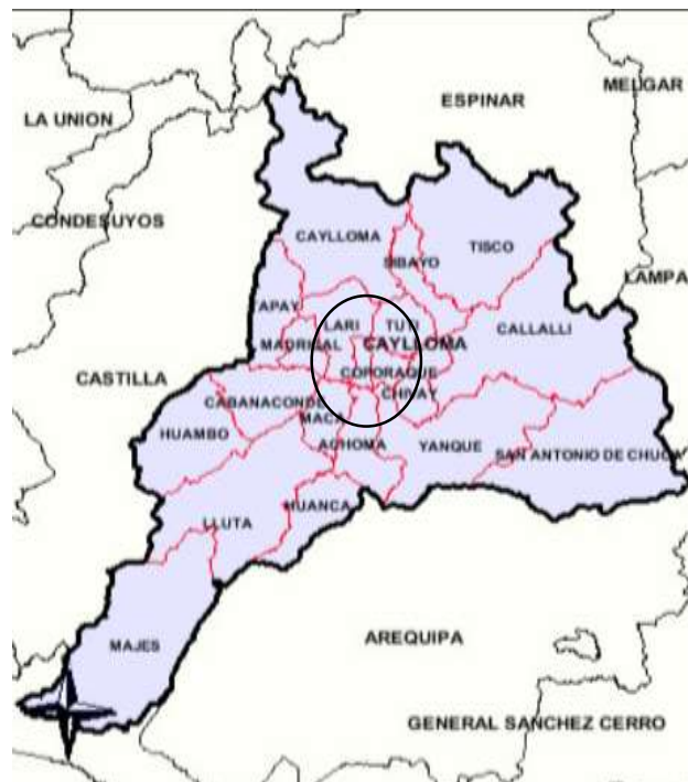
Gráfico N° 02 Área a intervenir