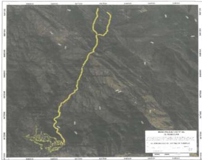
FIGURA N° 3.1 Fotografía satelital (elaborado por el consultor)

LICITACION PUBLICA N° 001-2022-MDR/CS - Primera Convocatoria- EJECUCIÓN DE OBRA – “MEJORAMIENTO, AMPLIACIÓN DEL SISTEMA DE AGUA POTABLE Y SANEAMIENTO BÁSICO EN EL CENTRO POBLADO DE SAN JUAN DE QUIHUARES DISTRITO DE RONDOCAN, PROVINCIA DE ACOMAYO – CUSCO” – Primera Convocatoria.