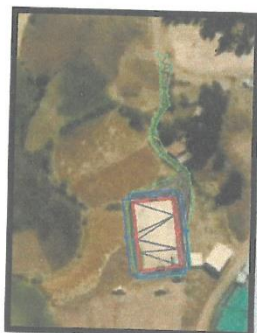
Grafica N°03 Micro localización del Proyecto

MUNICIPALIDAD DISTRITAL DE CHAVIN DE HUANTAR