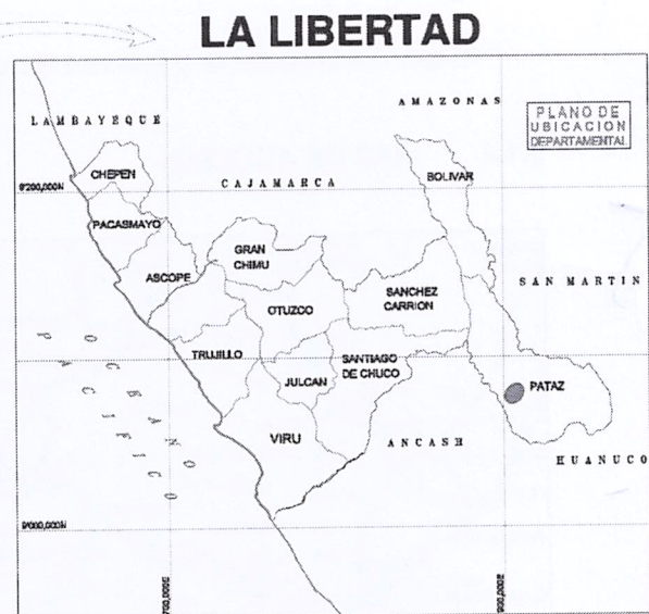
Imagen N°1: Ubicación de La Libertad