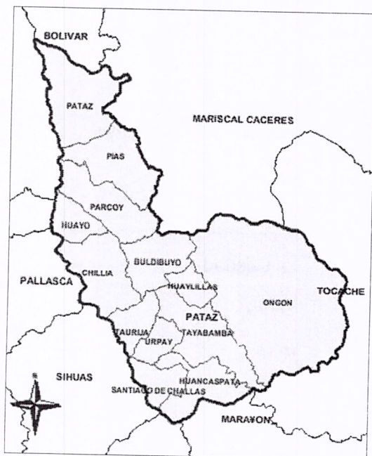
Imagen N°2: Ubicación de la Provincia de Pataz