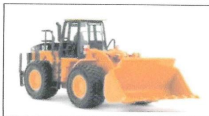
Foto referencial del Cargador Frontal sobre ruedas