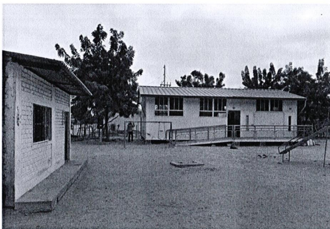
VISTA DEL INTERIOR

El Sector Tres Marías del Centro Poblado Vicús, actualmente cuenta con los Servicios Básicos de Luz, Agua Potable, pero no cuenta con Alcantarillado.