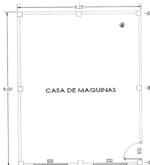
DIMENSIONES DE LA CASA CONTENEDOR VIVIENDA MULTIPROPÓSITO (CASA FUERTE), AREA DE 50M2