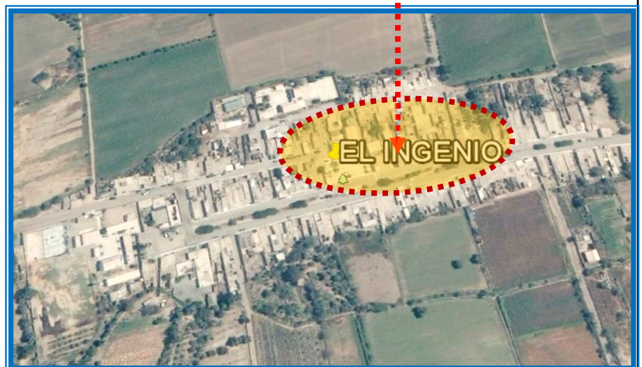
MAPA DEL DISTRITO DE INGENIO