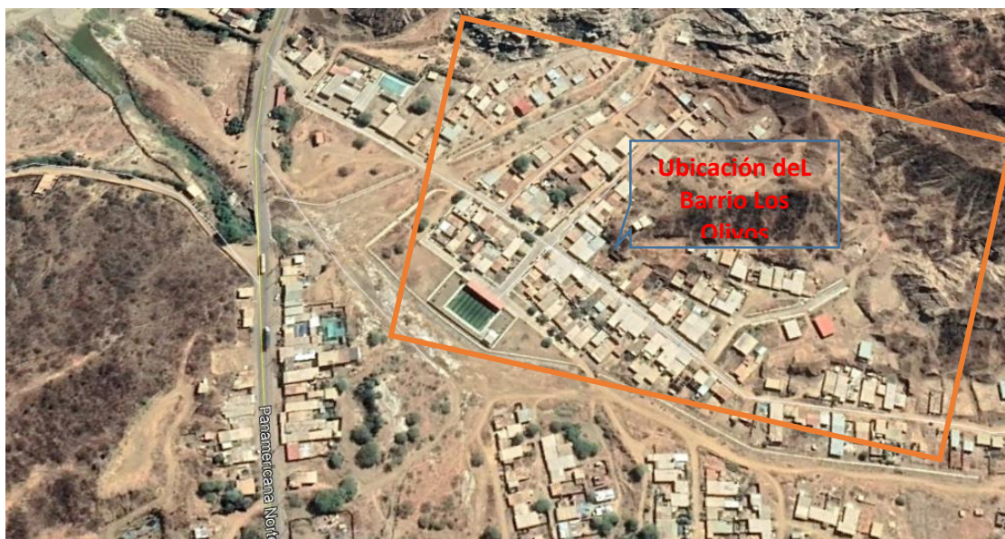
Ubicación del área del desarrollo del proyecto Barrio Los Olivos

Mapa de Ubicación en Coordenadas UTM (WGS84) del área del desarrollo del proyecto Barrio Los Olivos