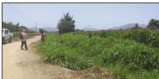
IMAGEN 03. TOMA 01