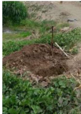
IMAGEN 12. PASE VEHICULAR – 04