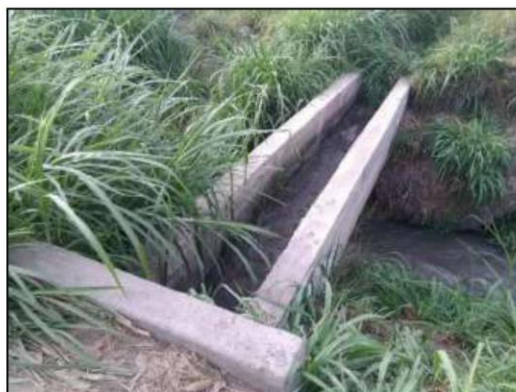
IMAGEN 07. CANOA - 01