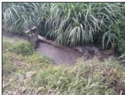
IMAGEN 08. TOMA - 03