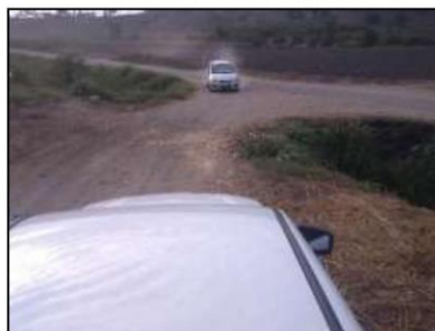
IMAGEN 11. PASE VEHICULAR - 03