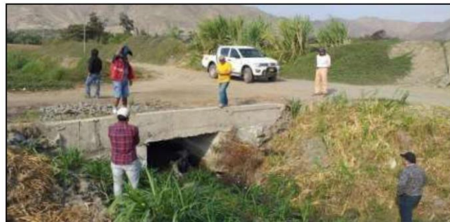
IMAGEN 04. PASE VEHICULAR - 01