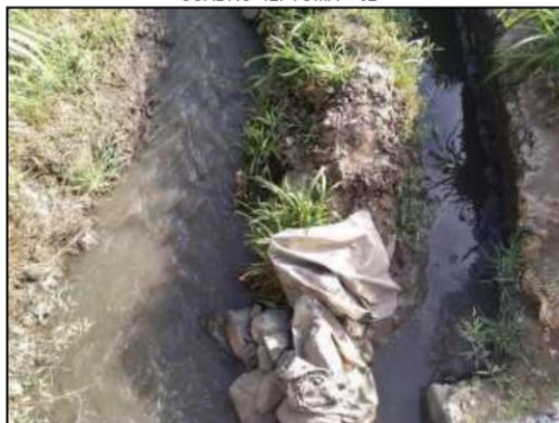
IMAGEN 05. TOMA 02