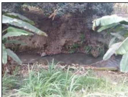
IMAGEN 06. PASE VEHICULAR – 02