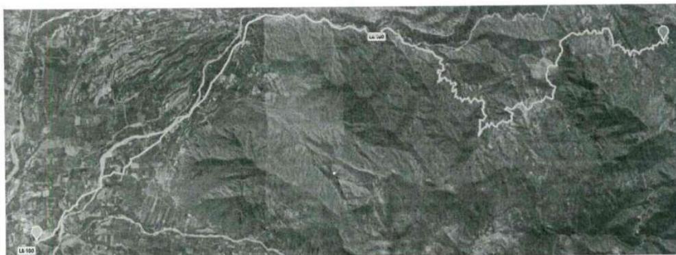
MAPA DE UBICACIÓN

Región : Lambayeque Provincia : Lambayeque Distrito : Motupe, Salas Localidades : Palo Blanco, Marripón, Huayros, Limón Pampa, Colaya Zona del proyecto : 17 Región natural : Costa Longitud : 38.00 km Ruta : LA- 100 Inicio : E: 644070.095 m, N: 9320674.531 m, Z: 144.00 m Fin : E: 665188.374 m, N: 9327085.964 m, Z:1348.00 m